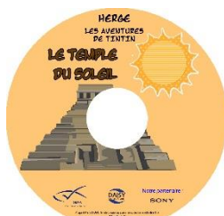
Le Temple du Soleil