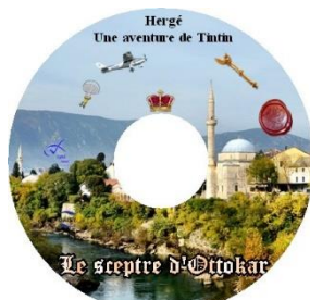
Le sceptre d'Ottokar