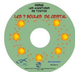
Les Sept boules de cristal