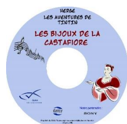
Les Bijoux de la Castafiore