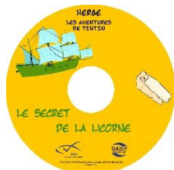
Le Secret de la Licorne