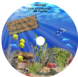
Le Trésor de Rackam Le rouge