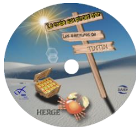
Le crabe aux pinces d'or