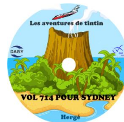
Vol 714 pour Sydney