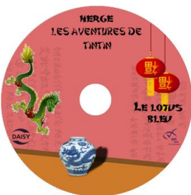
Le Lotus bleu